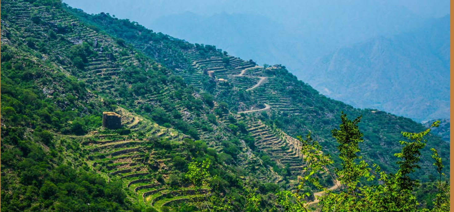
Agricultural Terraces From Asir Region