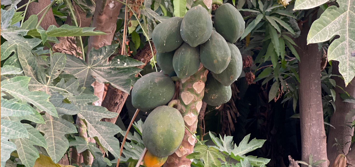
Papayas From Asir Region